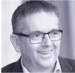
Michl József Tata város polgármestere

A Kárpátok alatt, ahol apám éltek, rendelj ki nekem is egy csendes menedéket. Csak akkora legyen, hogy elférjek én s a béke, nézzen az ablakom patakra, fára, rétre.