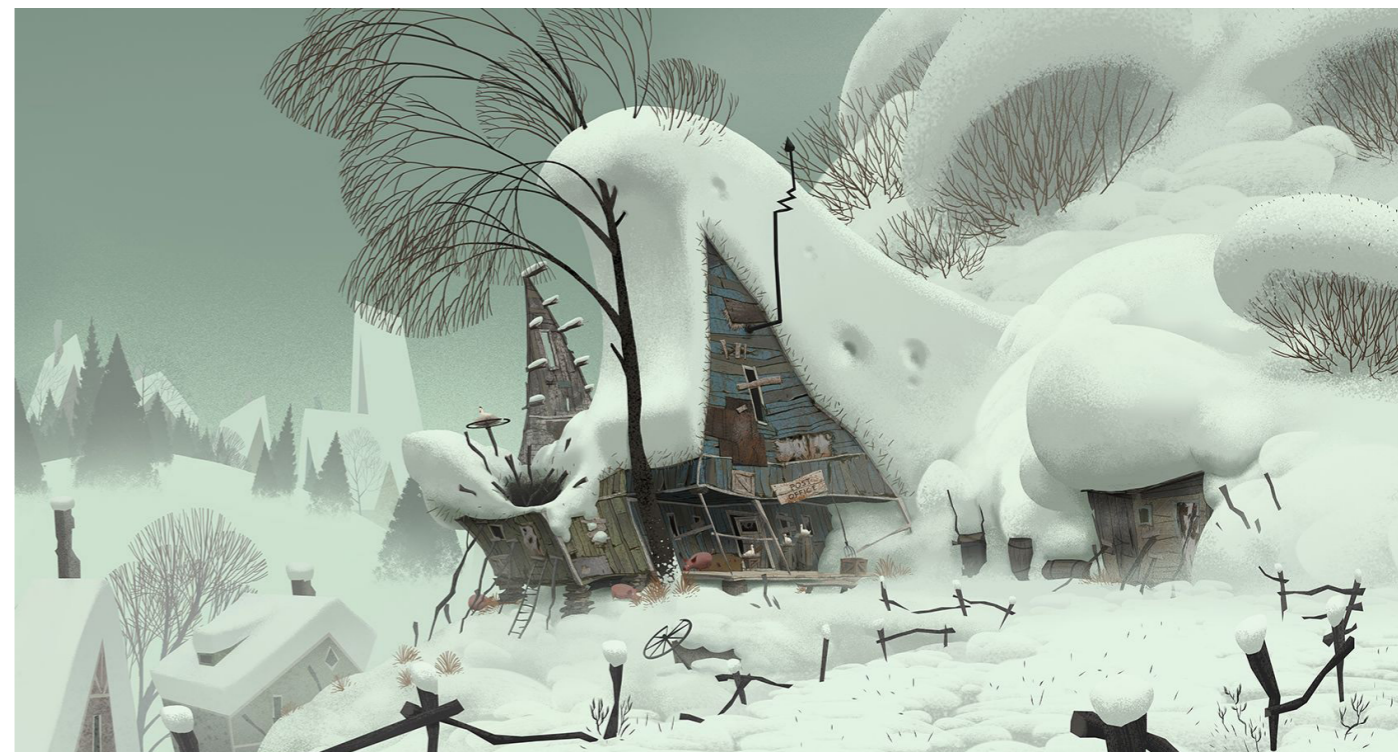
Külső látványterv, északi oldal a főbejárat felől

A kedvesség és az önzetlen jótettek az egész társadalmat megreformálják, egyre inkább elmosódik a Krumok és Elingboe-k közti határ. Ezért a 2 klán vezetője szövetkezik a közös ellenség, Jasper és Klaus ellen, hogy tönkretegyék a karácsonyi ajándékozási tervüket. A terv látszólag sikerrel jár, és Jaspernek is át kell értékelnie a tetteit és az értékeit, mérlegelnie kell, hogy mi az igazán fontos az életben. A végkifejlet mégis gyönyörű, hiszen Klaus öröksége az eltávozása után is tovább is él.