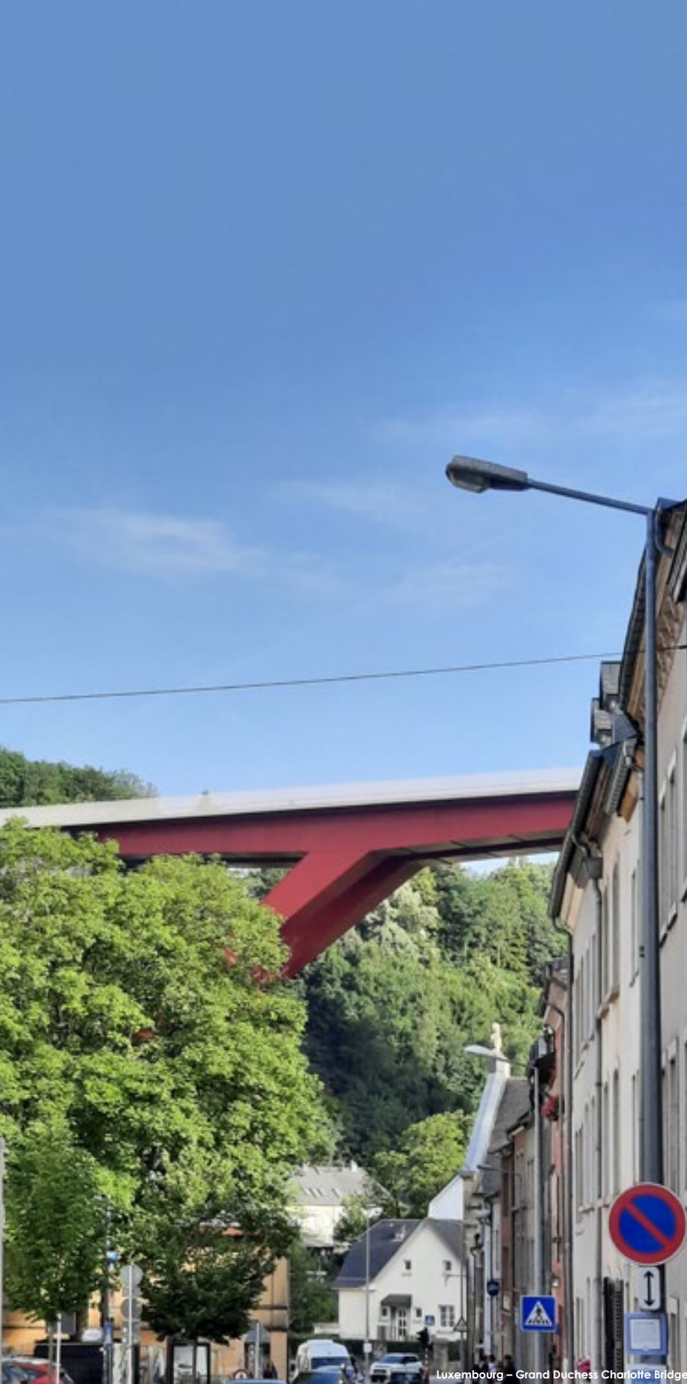
Luxembourg – Grand Duchess Charlotte Bridge

Luxemburg városaiban megtalálhatók a történelmi korokat őrző óvárosok és a modern, kortárs városrészek is, ezeket fonja össze a fejlett közlekedési infrastruktúra, ami segít áthidalni a domborzatában igen változatos településeket. A kis területű országban megjelennek történelmi és kortárs hidak, völgyhidak, városi lift, sikló, villamos és a kiterjedt vonat- illetve buszhálózat.