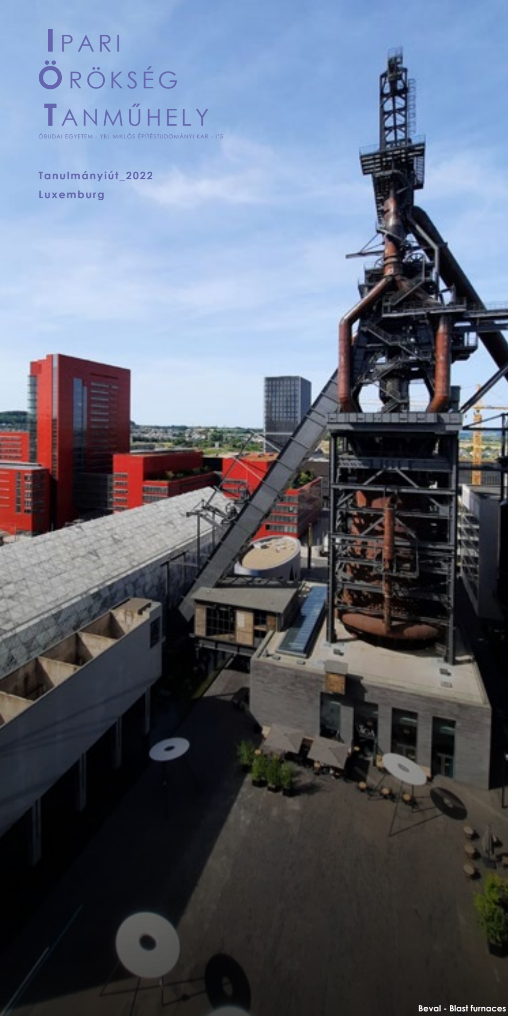
Beval - Blast furnaces

Luxembourg ma is az acélgyártás központja, a világ egyik legjobb minőségű acélját a miniállamban gyártják. A XX.század második felétől igen visszaesett a termelés viszont a bezárt vasércbányák és gyárterületek viszont nem állnak üresen, az élelet a kulturális, tudományos és üzleti negyedek kialakulása hozta vissza az egykor virágzó ipari területekre. Iide látogatott el az Ipari Örökség Tanműhely (I'5) 2022-ben. Öt városban ismerhették meg a hallgatók a luxemburgi ipar történetét, és azokat a kortárs építészeti, infrastruktúrális elemeket amiktől az ország a 2022-es Európa Kulturális Fővárosaként is hasznosított.